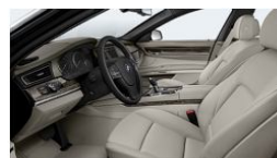
LCDH - Couro Dakota Oyster | Oyster Escuro