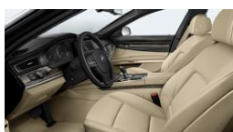
LCDF - Couro Dakota Bege Veneto | Bege Veneto