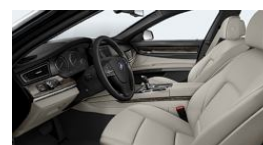
LCCX - Couro Dakota Oyster | Preto