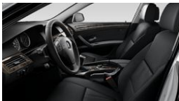
LCSW – Couro Dakota preto