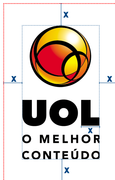
x = \text{largura do L}