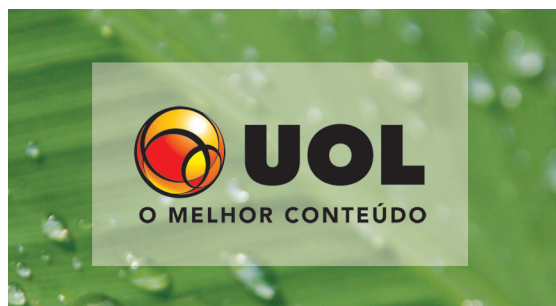
Aplicação de retângulo branco com 50% de transparência