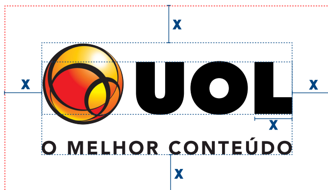
x = \text{largura do L}