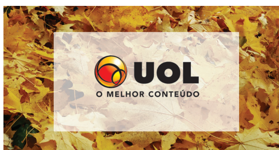
Aplicação de retângulo branco com 30% de transparência