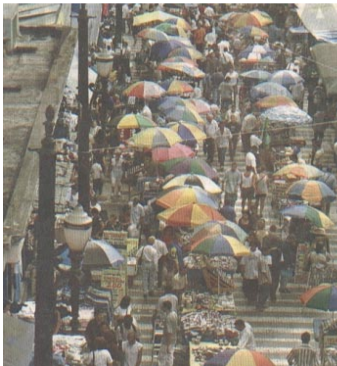
Camelôs na Ladeira General Cardoso em São Paulo-SP.