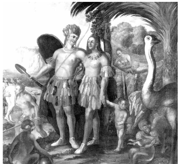
Charles Le Brun (Paris 1619-1690). "América".

O quadro pretende mostrar os habitantes do continente americano e seus costumes, contudo os ameríndios aparecem com feições apolíneas e cabelos anelados. Nesta representação, como em muitas outras, os personagens mais se assemelham aos europeus do que propriamente aos povos da América. O quadro, assim, acaba nos dizendo mais sobre o olhar do próprio europeu do que sobre aqueles que procurava retratar. A identidade dos grupos humanos é uma característica fundamental para a criação de um "nós coletivo" que, ao mesmo tempo, identifica e diferencia os grupos entre si. Sobre a identidade, considere as afirmativas a seguir.