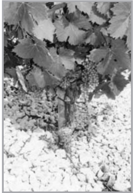
Videira em Languedoc, região mediterrânea da França.

Popularmente, os vicultores costumam afirmar que os solos ideais para o cultivo de uvas para produção de vinho devem ser pobres. São aqueles que possibilitam o amadurecimento lento das uvas e não um crescimento grande e acelerado das plantas. É lógico que esses "solos pobres" são muito valiosos para a lavoura vinífera, mas são tidos como tais tendo em conta a idéia de fertilidade em geral. Com relação a essa questão é correto afirmar que