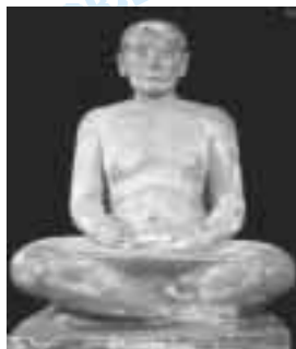
Egito antigo: O Escriba Sentado. século XXVI a.C.