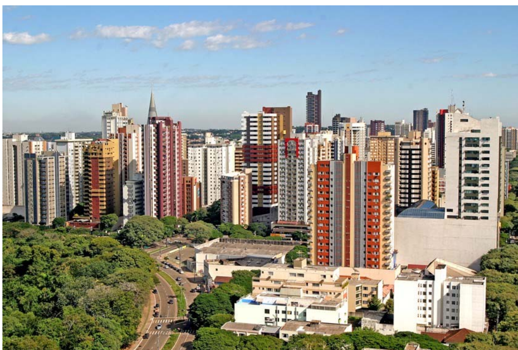
Região Central de Maringá