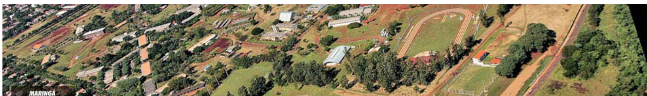
Vista aérea do campus da UEM - Maringá