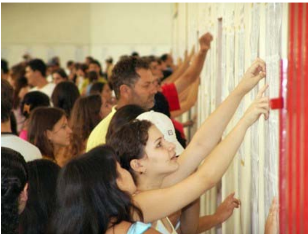
Divulgação do Resultado do Vestibular da UEM

O resultado do Concurso Vestibular de Verão 2008 será válido apenas para o período a que se refere e seus efeitos cessarão, de pleno direito, com o prazo final de registro e matrícula.