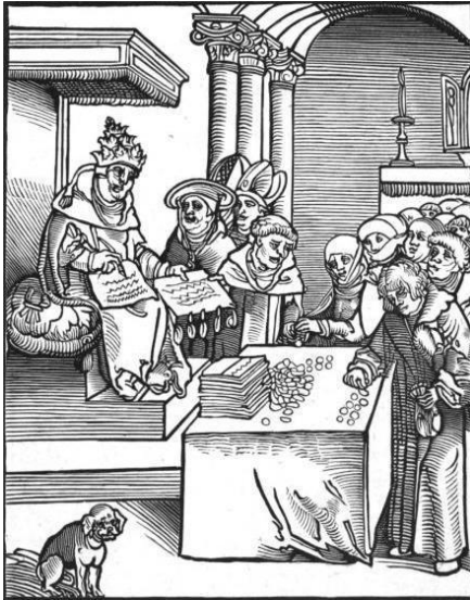
Gravura retratando a venda de indulgências - O Anticristo, de Lucas Cranach, 1521.

Questão 2: O texto e a gravura abaixo se referem ao contexto de um importante processo histórico ocorrido no século XVI em vários países europeus.