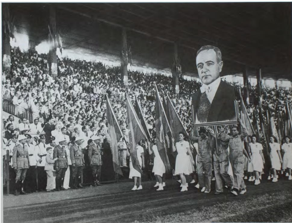
Monteiro, A. "Dia do Trabalho no campo do Vasco da Gama." [Fonte: Getúlio Vargas 1983 - Exposição de Fotografias, página 60]