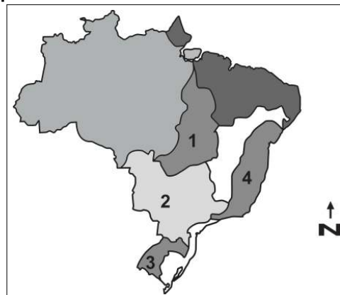
Mapa 2: Brasil - Principais bacias hidrográficas