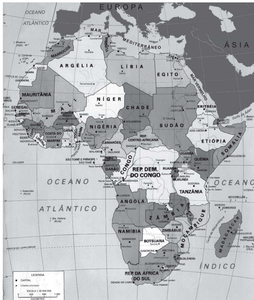
(Atlante geografico metodico De Agostini. Novara, Instituto Geográfico De Agostini, 1997.

In: ALMEIDA, L. M.; RIGOLIN, T. B. Geografia . São Paulo: Ática, 2002. p. 319.)