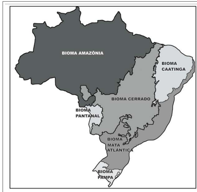
Mapa 1: Biomas brasileiros

(Disponível em: <www.ibge.com.br.> Acesso em: 10 jul. 2007.)