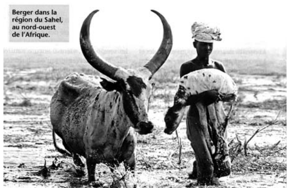
Berger dans la région du Sahel, au nord-ouest de l’Afrique.

“L’expérience historique de la traite et de l’esclavage a élargi, rendu plus intense la perception que les Noirs (Afrique et Diaspora) peuvent avoir de la réalité. Là où les occidentaux ne voient que de simples phénomènes de la nature, les Noirs aperçoivent des manifestations fantastiques. Pour le Noir, la mer, les rivières, les tempêtes, l’arbre sont habités par des forces surnaturelles. [...]”