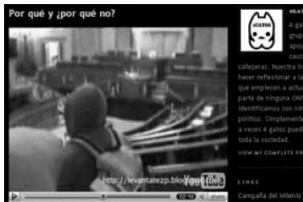
Fotograma del vídeo colgado en la red que muestra a dos encapuchados en el hemiciclo del Congreso de los Diputados

El vídeo difundido por Internet es obra de un colectivo que pretende publicitar la Campaña del Milenio de la ONU.