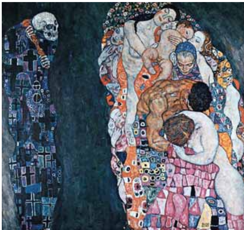
Gustav Klimt. A Vida e a Morte , 1916. Internet: < www.cgfa.acropolisinc.com >.

Considerando que os textos da prova e os fragmentos acima apresentados têm caráter unicamente motivador, redija um texto dissertativo a respeito do tema a seguir.