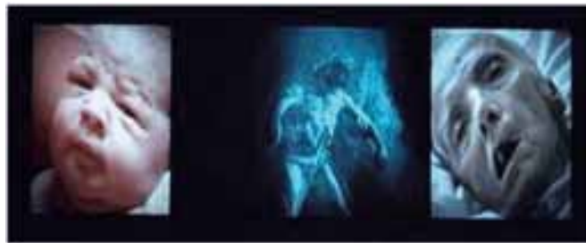
Bill Viola. The Passing . South London Gallery, London, England, 1991.

Requiem aeternam dona eis, Domine (Repouso eterno, concede-lhes, Senhor). Com essas palavras, inicia-se o intróito da missa pro defunctis (missa para o falecido), também conhecida como missa de réquiem (ou, simplesmente, réquiem), cerimônia da liturgia católico-romana na qual se honra a alma de uma pessoa falecida, ou de mais de uma, e por ela se intercede. As seções da missa que eram originalmente cantadas de forma monofônica pelo oficiante passaram a ter um tratamento musical mais elaborado e em vozes a partir da Idade Média. Desde então, tais seções suscitaram grande número de composições musicais, primariamente destinadas ao uso litúrgico, como, por exemplo, o famoso Requiem , de W. A. Mozart. No entanto, o caráter dramático do texto, especialmente na Sequência, na qual se descreve o dia da ira de Deus e o iminente julgamento da humanidade no dia do juízo final, resultou em concepções que fizeram do réquiem um gênero próprio, especialmente no século XIX, havendo versões não apropriadas para uso na igreja, principalmente em virtude do grande número de instrumentos e vozes empregados nesse gênero musical.